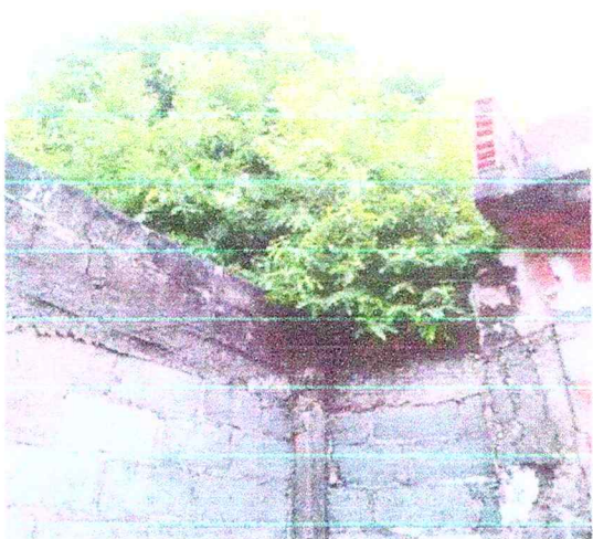
Ramas de árbol vecino que están afectado el muro y genera suciedad en mi patio.

Anexos: Registro fotográfico de las afectaciones descritas