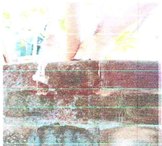
Ramas de árbol vecino que están afectando el muro y genera suciedad en mi patio