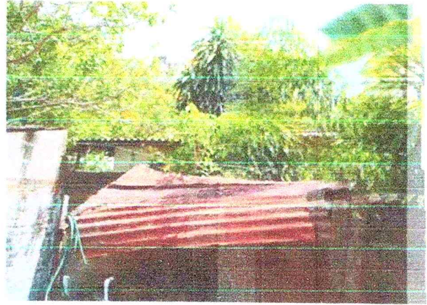
Ramas de árbol vecino que genera suciedad en mi patio