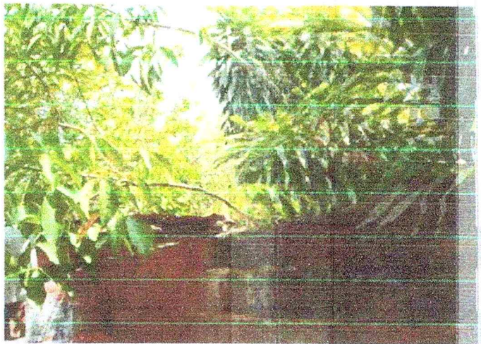
Ramas de árbol vecino que genera suciedad en mi patio y afecta la estabilidad del muro