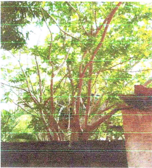
Ramas de árbol vecino que genera suciedad en mi patio y afecta la estabilidad del muro